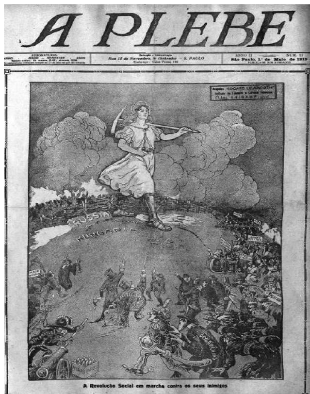
Capa de A Plebe , ano II, nº 11, 1º de maio de 1919.